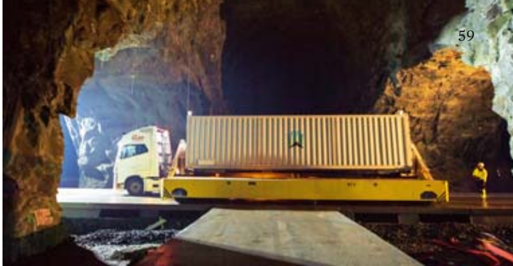
Wert-Transport Ein Container aus Deutschland, in dem Superrechner Bitcoins schürfen, fährt in die norwegische Mine ein

Trotzdem versuchen es einige Miner: So plant etwa ein Firmenteam mithilfe des Dienstleisters Innovo Cloud, der auch die Container für Northern Bitcoin ausrüstet, genau die Energie zum Schürfen der digitalen Währungen zu nutzen, die bisher mit Verlusten ins Ausland verkauft werden muss – wenn deutsche Windräder mehr Strom produzieren, als hierzulande benötigt wird. Vor allem die Kraft des Wassers betört die Szene. Beispielsweise in Plattsburgh, einem Ort mit 20 000 Einwohnern im Norden der USA, an der Grenze zu Kanada, nicht weit von den Niagarafällen und ihren großen Wasserkraftreserven. Plattsburgh bekommt jährlich eine bestimmte Menge an Strom aus Wasserkraft zugeteilt – zu fast unschlagbar günstigen Preisen, die wohl noch deutlich unter den vier Cent pro Kilowattstunde der Mine in Norwegen liegen. Doch die energiehungrigen Bitcoin-Unternehmen, die sich in dem Städtchen angesiedelt haben, drohen das Reservoir zügig auszuschöpfen. Laut der Nichtregierungsorganisation American Public Power Association sollen zwei Miner in Plattsburgh mit 11,2 Megawatt rund ein Zehntel der Kapazität des Ortes abzapfen. Die Gemeinde müsse Strom für ihre Privatkunden teuer zukaufen, heißt es. Bürgermeister Colin Read zog deshalb bereits den Stecker: Für 18 Monate sollen in seiner Stadt