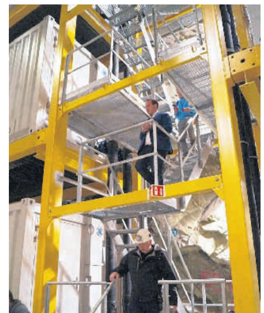
Die 17 m hohen Felskammern lassen es zu, drei IT-Container übereinanderzustellen.