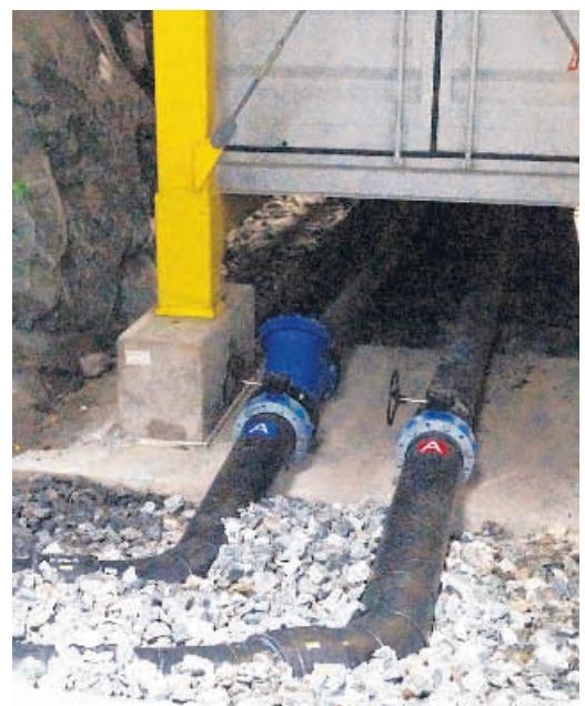
Fjordwasser wird über Wärmetauscher zur Kühlung eingesetzt.