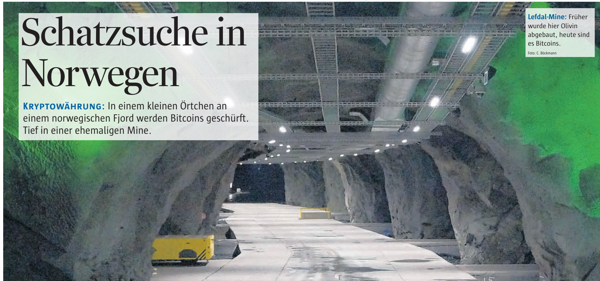
Lefdal-Mine: Früher wurde hier Olivin abgebaut, heute sind es Bitcoins.

Nun versucht Betreiber Lefdal die Mine anderweitig zu nutzen. Insgesamt 120 000 m 2 könnten Platz für 1500 IT-Container bieten. Bisher gehört Northern Bitcoin mit seinen 15 aber zu den Pionieren. Die meisten Felskammern sind noch leer. Dabei sprechen für den Standort deutliche Argumente. „Der Strom ist hier so günstig wie nirgendwo sonst in Europa“, wirbt Lefdal. Konkret zahlt Northern Bitcoin zwischen 3,2 Cent/kWh bis 4,4 Cent/kWh – und das für