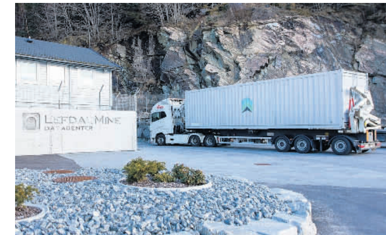
Ein neuer IT-Container kommt in der Lefdal-Mine an: Vollgepackt ist er mit 210 „Antminer S9“. In jedem von ihnen sind 189 „16-nm-Asic-Chips“ verbaut. Der Container selbst stammt von Rittal.