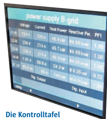
Die Kontrolltafel im Containerinneren gibt Aufschluss über alle wichtigen Daten.

Seinen CTO muss Schultz auf dem Weg bezahlen, den er so verachtet – per Banküberweisung. Nach deutschem Recht muss im Arbeitsvertrag das Gehalt in Euro angegeben sein. Bis es Bitcoins von der norwegischen Mine auf deutsche Lohnzettel schaffen, wird noch einiges Schmelzwasser den Fjordfelsen herunterlaufen.